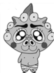
寒川町文化財学習 センターキャラクター つりてくん