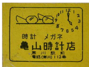
1957年のマッチラベル