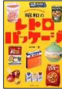
『昭和のレトロパッケージ』