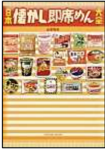
『日本懐かし即席めん大全』

図書館には、個性的な本がたくさんあります。 今回は、その中から「なにか」にこだわった、 「マニアック」な本をご紹介します。 眺めるだけで、クスッと笑みがこぼれるかも♪