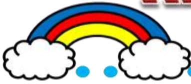
寒川総合図書館オリジナルキャラクター