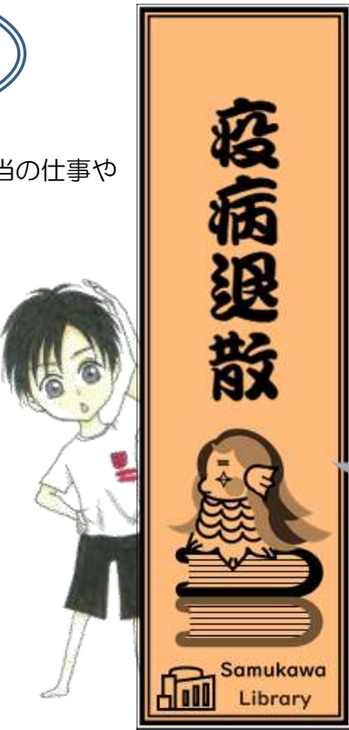
流行の妖怪「アマビエ」をオリジナルデザインしたしおりを作成。館内で配布しています♪