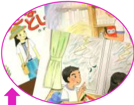
なんと！物語も絵も完全オリジナルの手作り紙芝居を作ったスタッフも！