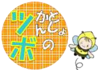
スタッフおすすめの1冊を紹介するPOPを手づくり♪1階の雑誌コーナーで展示を実施しています。