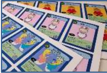
☆新企画の記念品を量産しました♪

自宅勤務の日には、それぞれが担当の仕事やイベントの準備、調べものなど工夫して在宅ワークを行いました。その中の一部を紹介します。