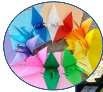
コロナウイルスの終息を祈ってみんなで千羽鶴を折りました。